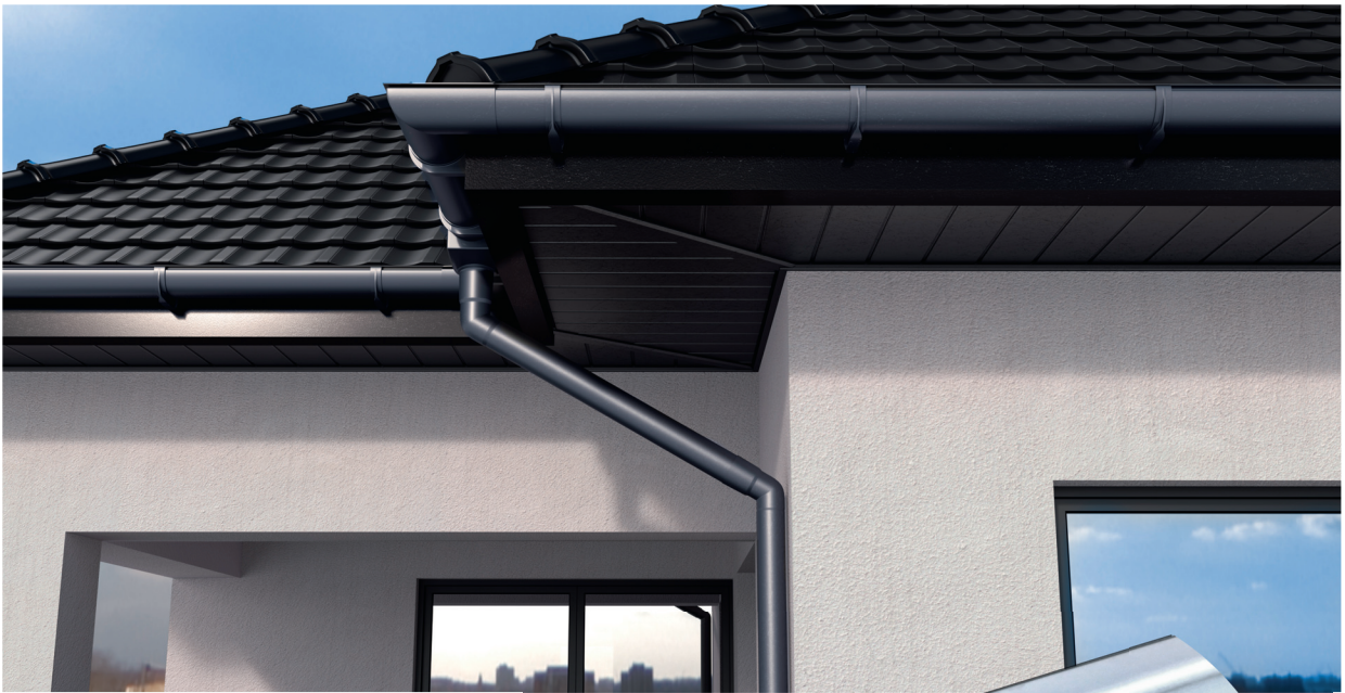
Zdjęcia prezentują zamontowane systemy PLASTMO PVC.